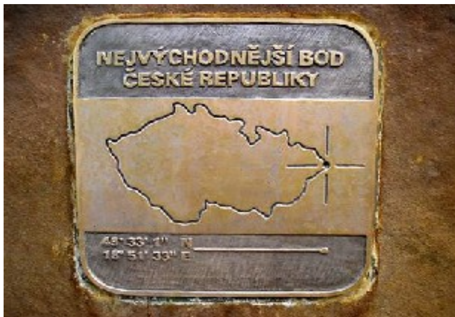
Tabulka vsazená do památníku nejvýchodnějšího bodu ČR u obce Bukovec

Hodně lidí si myslí, že nejvýchodnější obcí Česka je malebná Hřčava a nejvýchodnějším bodem nedaleké trojmezí. Není tomu tak! Nejvíce na východ jsou vystrčeny poslední domy vesnice Bukovec. U Bukovce, na hranici s Polskem, se také nachází nejvýchodnější místo ČR. Zjistit přesné souřadnice tohoto bodu vyžaduje tak trochu tajnou misi.