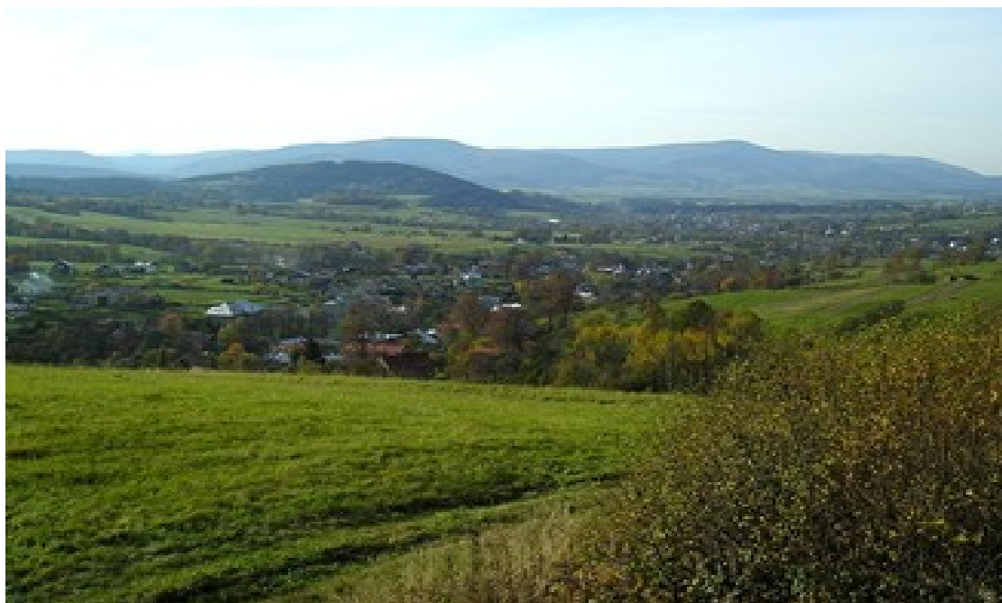
Bukovec - nejuvýchodnější obec ČR

Tyhle překrásné, nadmíru pravdivé a vzletné věty si přečtete na tabuli u nejuvýchodnějšího bodu České republiky, který je ukrytý v lesíku u potoka na česko-polské hranici ve Slezských Beskydech.