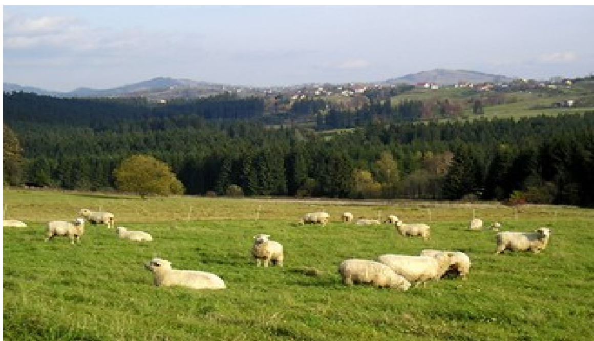
Jedna z nejvýchodněji položených pastvin v ČR, v dálce polská krajina Slezských Beskyd.

Pokud zbude v Bukovci čas před odjezdem autobusu, můžete zavítat kromě hospody do malého muzea v budově polské školy.